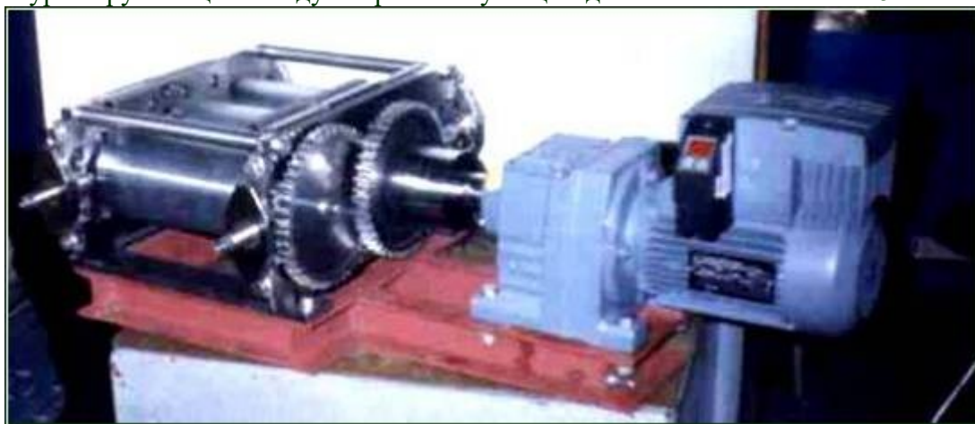
На фото мельница без кожухов, без бункера и без лотка.

Температура окружающего воздуха при эксплуатации должна быть не менее 15°C.